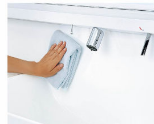
一体成形カウンターで お手入れ簡単。