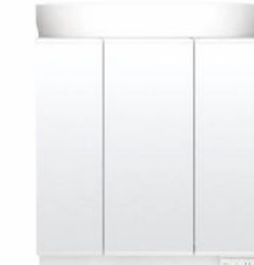
スタンダードLED照明・3面鏡・全収納 MEB-753TXSU