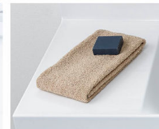
カウンターは 仮置きスペースにピッタリ。