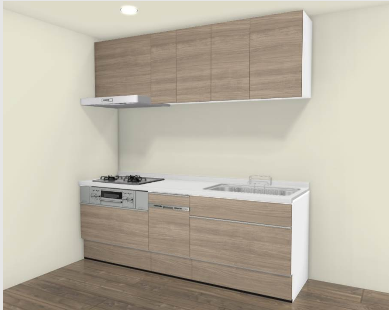
実物を撮影した画像ではないため、実物と異なる場合があります。見積記載品以外はイメージです。*床名：ウォルナットF(DZ)横・ラシッサD