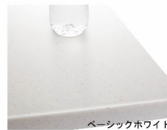
ベーシックホワイト 人造大理石トップ

インテリアに合わせてカラーコーディネート。耐久性にも優れた人造大理石トップです。